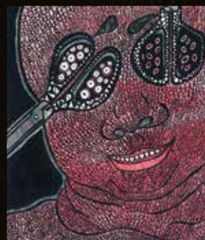
鮎万里絵《問題の在処》2007