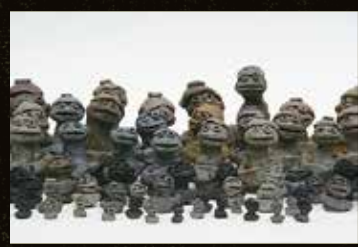
山際正己《正己地蔵》