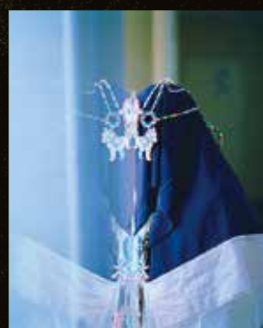
齋藤陽道 《はじまりのなにものか》2015