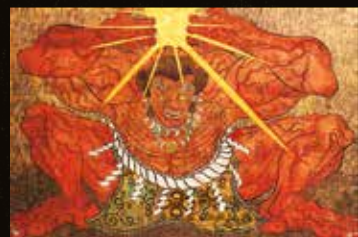
金子富之《天手力男神 / Tajikarao》2014