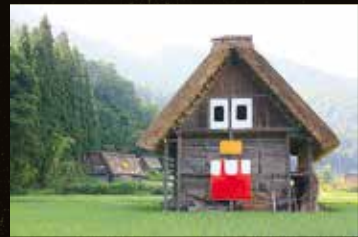
小中大地《合掌ゴブリンをつくろう!!》2015