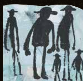
神林美樹《ドロボーたち》2014