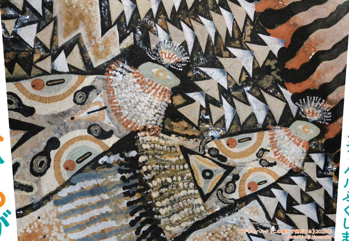
スギサキハルナ《この場所で開花する》2025年