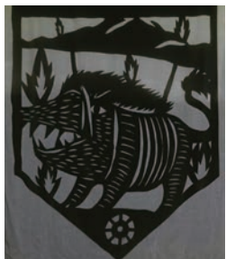
小池晶子《ウォールアートフェスティバル ふくしまin猪苗代2025に向けたプロトタイプ》