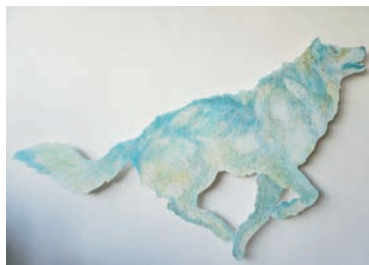
岩切章悟《自由浮遊惑星 Lobo A》2022年