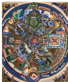
香川大介《はじまり》2025年