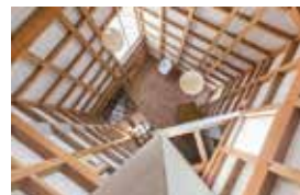
アサノコウタ《福島の自邸》2016