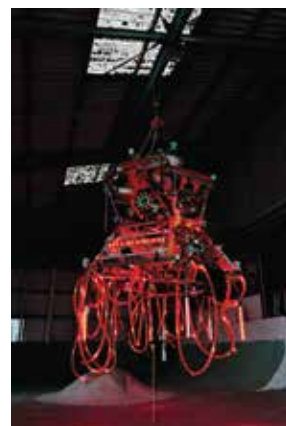
SIDE CORE 《rode work》2017