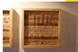
平井有太 《socialscape: 福島の場合》2016