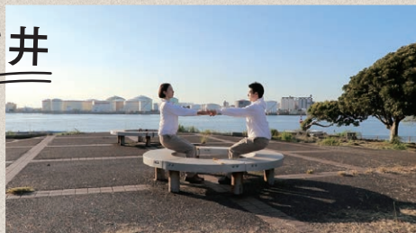
アグネス吉井《水平 Horizontal》2023年