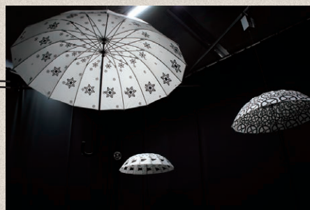
パンタグラフ《ストロボの雨をあくる》2015年 created for Exhibition "Motion Science" at 21_21 DESIGN SIGHT, 2015