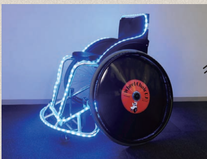
望月茂徳《車椅子DJ》2012年～

アクセス：猪苗代駅より徒歩25分、タクシーで5分。猪苗代磐梯高原ICより車で一般道12分。バスの方は、JR猪苗代駅バス乗り場より、裏磐梯方面行きまたは中ノ沢方面行きの会津バスに乗車→「バスセンター」下車(徒歩3分)。駐車場は美術館西側に15台。手打ちそば「しおや蔵」共用