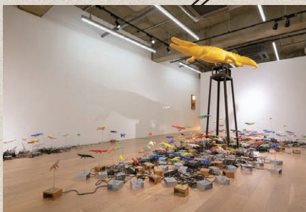
タムラサトル《スピンドロコダイル・ガーデン》2014年～2022年 TEZUKAYAMA GALLERY Viewing Room