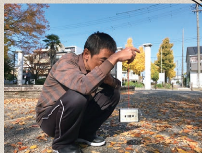
藤本正人《Negative capability ―つづいていられる能力―》1985年～