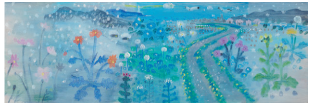
小池アミイゴ《東日本10年》2021年

1988年よりフリーのイラストレーターとして活動をスタート。2000年代は地方を巡り、地域の方々とのコラボで展覧会、ワークショップ、音楽イベントなどの開催を重ねる。2011年3月11日以降東北の各地を巡り作品を制作、個展「東日本」を継続開催。