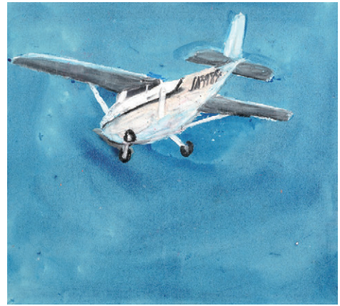
西澤彰《無題》制作年不詳

主な出展歴に、「アートと表現の展覧会 in 富岡製糸場 2026」（2026/ 富岡製糸場 / 群馬）、「繰り返しの極意II」（2026/ もうひとつの美術館 / 栃木）など多数。