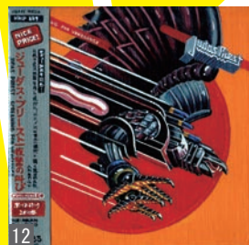
1. 門秀彦 2. 青木玲子 3. 小澄源太 4. 岡元俊雄 5. 磯崎晃宏 6. 西岡弘治 7. 田湯加那子 8. 尾形和記 9. ケンジ&カズヒサ 10. 人見紗操 11. 小林覚 12. 相川勝